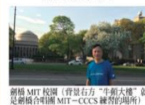
劍橋 MIT 校園（背景右方「牛欄大樓」就是劍橋哈佛園 MIT-CCCS 練習的場所）