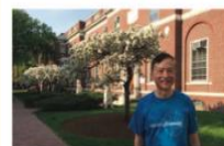
劍橋 哈佛大學 校園