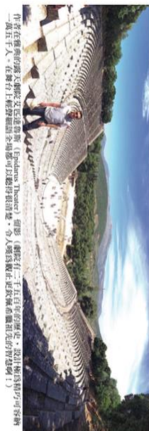
「萬里千川，在綠石上輕盈地舞動，如雲如霧，令人驚嘆不已，這真是一個令人驚嘆不已的奇蹟啊！」