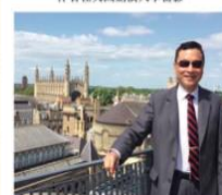
作者在英國劍橋大學留影