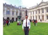
作者在英國劍橋大學留影