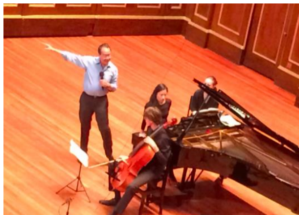
馬友友大師在NEC Jordan Hall舞台上親自指導學生很生動的實況